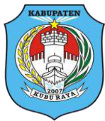
TABEL 2. 2.2